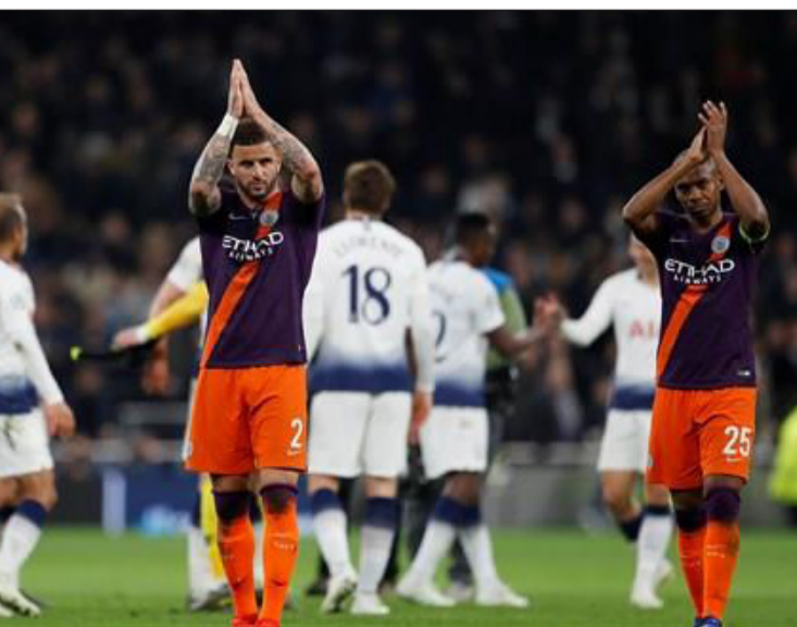
بغداد - الجورنال